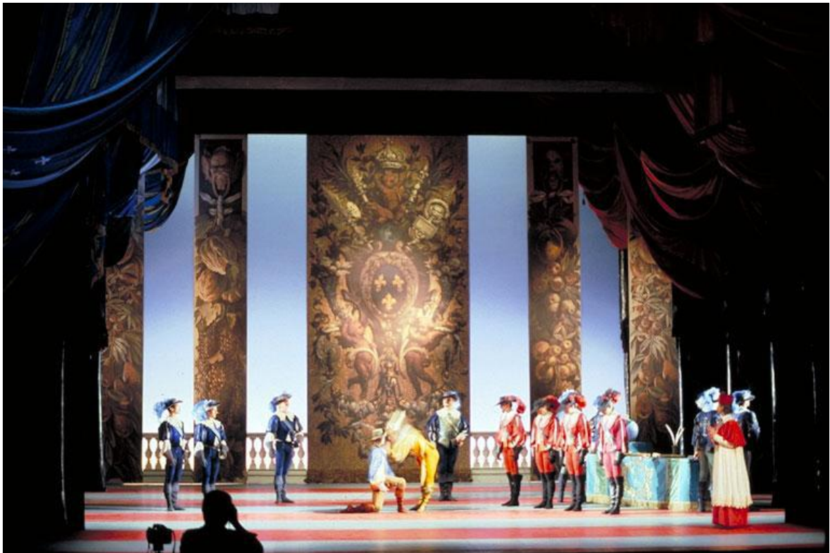
Impression sur coton: un décor qui se change comme un jeu d'enfant