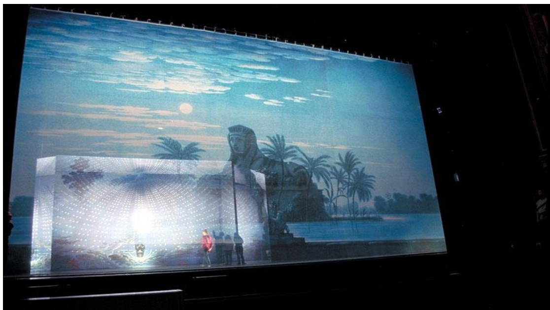
Impression sur tulle avec coutures "invisibles". Seconde image derrière le tulle : un rétroprojection

Ci-dessous quelques décors de théâtre et d'opéra imprimés sur toile coton, tulle, soie, « lino » et tapis de danse.