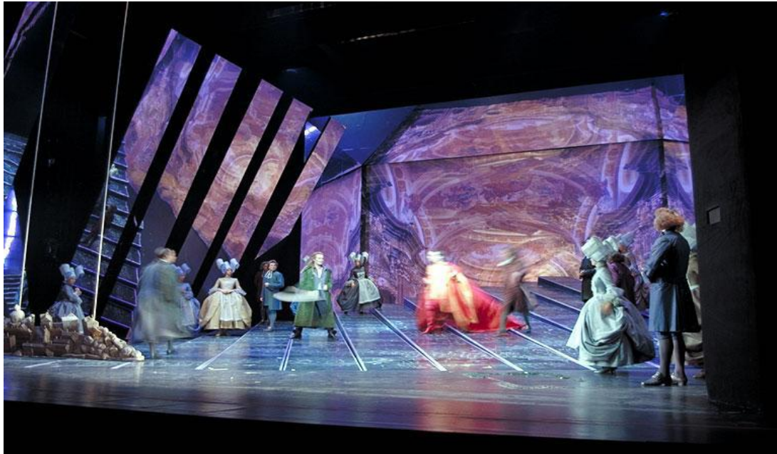
Comédie musicale : impression sur coton

Nous imprimons sur une large gamme de textiles. Toutes nos toiles coton et tulle sont 100% coton sans adjuvant (gel) ou âme polyester (tous deux destinés à rigidifier le support afin qu'il puisse passer dans les machines sans se mettre en travers) garantissant ainsi une matité et une souplesse parfaites.