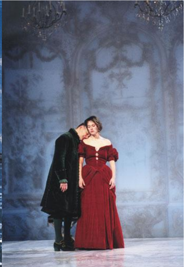
Décor vertical sur coton, « lino » au sol